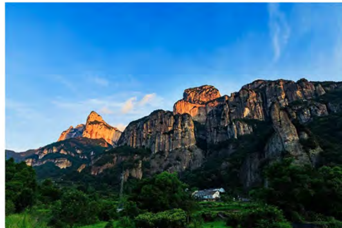
雁荡山景区观音峰

4月1日至6日、4月28日至30日，浙江温州雁荡山景区面向全国中小學生推出门票全免， 随行2名成人享受五折门票 ；温州龙湾潭景区春假期间为中小學生和 1名同行家长免票 。